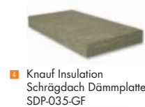
4 Knauf Insulation Schrägdach Dämmplatte SDP-035-GF